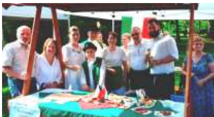
Május 21./ Nemzeti kisebbségek napja a Lužánky parkban