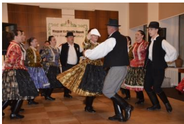
November 25./ A Magyar Kulturális Napok gálaestje