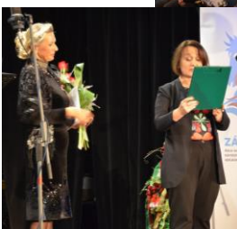
December 8./ 25 éves a CSMMSZ ostravai egyesülete